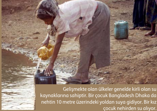
Gelişmekte olan ülkeler genelde kirliliğe sahip su kaynaklarına sahiptir. Bir çocuk Bangladesh Dhaka da nehtin 10 metre üzerindeki yoldan suya gidiyor. Bir kız çocuk nehirden su alıyor.

yaklaşık 60 000 dolar tutuyor. 80 metre derinlikteki kuyu saatte 10 000 litre pompalıyor. " Hult'a göre su kalitesi İsveç standartlarına uygun. Lionlar gelmeden önce en yakın su kaynağı köye 5 kilometre uzaktaki köyde , el pompası ile su çekilen bir kuyuydu.