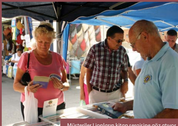
Müşteriler Lionların kitap sergisine göz atıyor.

Elde edilen gelire ihtiyaç sahibi ailelere gıda ve giysi, gözlük, tıbbi malzeme ve çocuk parkı ekipmanı alınmaktadır. Kulüp ayrıca rehber köpek, kanser destek grubu, kadın sığınma evi ve benzeri konularda da destek sağlamaktadır.