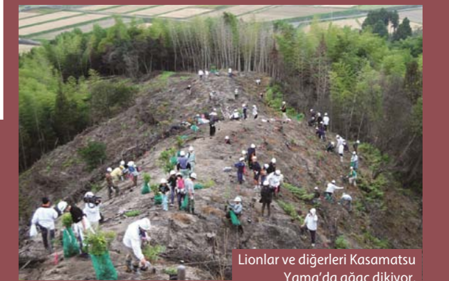
Lionlar ve diğerleri Kasamatsu Yama'da ağaç dikiyor.

Japonya'da Saijō yakınlarında küçük bir dağ olan yeşil deniz Kasamatsu Yama, 2008'in sıcak, kuru bir yazında dikkatsizce atılan bir sigara izmariti sonucunda yangına yakalandı. Alevler en sonunda, yağmur tarafından söndürüldü, ancak o ana kadar ciddi anlamda zarar ortaya çıktı. Orada yaşayan halkın ' anavatan dağı' olarak adlandırdıkları tepe, kül yığınına döndü.