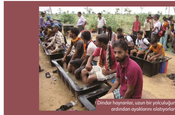
Dindar hayranlar, uzun bir yolculuğun ardından ayaklarını ıslatıyorlar.

Hindistan'da her yıl düzenlenen Ramdevra Şenliği'nde, hem Hindular hem de Müslümanlar tarafından saygı gösterilen ve 15. yüzyılda yaşamış olan azizlerden Papa Ramdev'in yaşamı kutlanır. Binlerce hayranı, bazıları yüzlerce kilometreyi yalın ayak yürüyerek, onun onuruna inşa edilmiş olan tapınağa yürür.