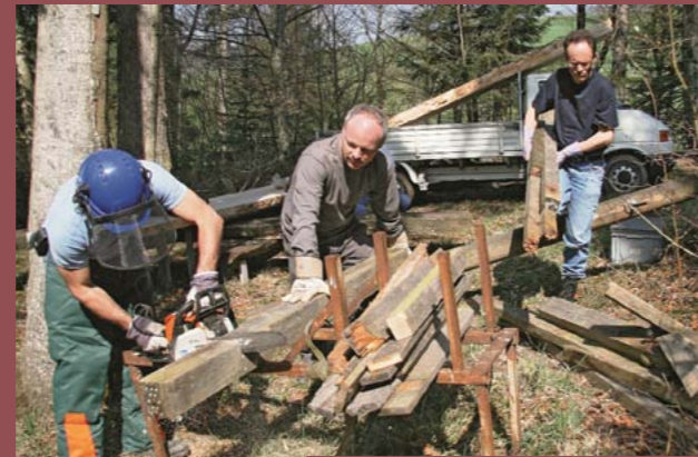
Lionlar bir sonraki eğlence zamanı için koruyu hazır hale getiriyor.

Yürüyüş yapanlar ve piknikçiler İsviçre'nin Rotiholz bei Arni'sindeki doğal patika manzarasından müthiş keyif alırlar. Worbental Lionları, korunun temiz ve güvenli kalmasını sağlarlar. Her yaz ateş çukurlarını temizler, tahta bankları onarır, bilgilendirici işaretler asar ve hatta teleferiğin güvenliğini bile kontrol ederler.