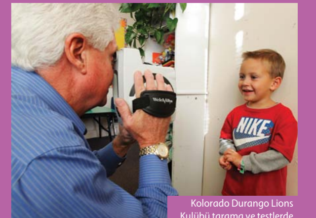
Kolorado Durango Lions Kulübü tarama ve testlerde