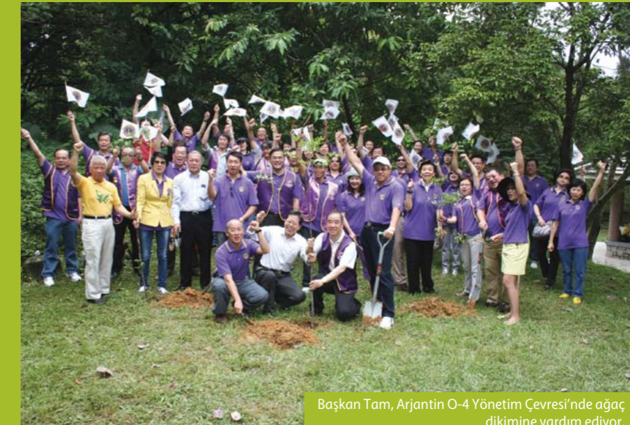
Başkan Tam, Arjantin O-4 Yönetim Çevresi'nde ağaç dikimine yardım ediyor.

B ir Çin atasözü, kalplerimizde bir yeşil ağaç tutarsak şarkı söyleyen bir kuşun bize gelebileceğini söyler. Bu Lionistik yılın son birkaç ayına geldiğimiz şu günlerde, kesinlikle söyleyebilirim ki, biz Lionlar milyonlarca yeşil ağaç diktik, kalplerimiz ve zihinlerimiz başkalarına karşı iyi dilekler ve inançla dolu ve 'şarkı söyleyen kuşlar' güzel alanlar, daha temiz bir hava ve toprağın korunması kılıfına bürünerek dünyanın her köşesinde vahşi yaşamı yumuşatıyorlar. Diktiğimiz ağaçlar 'İnanıyoruz' un gücüyle ortaya çıktı.